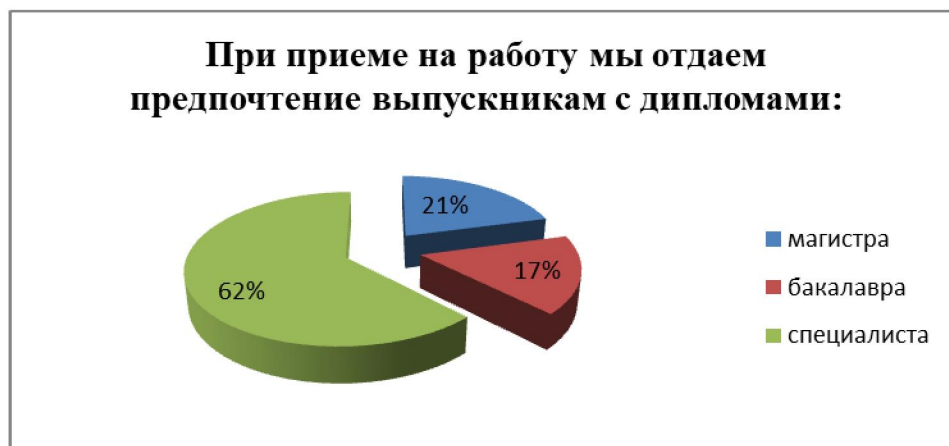
Рисунок 1 - Предпочтения работодателей при приеме на работу выпускников

По результатам проведенного нами исследования видно, что большинство работодателей отдают предпочтение выпускникам со степенью специалиста, чем бакалавра или магистра. Результаты исследования представлены на рисунке 1.