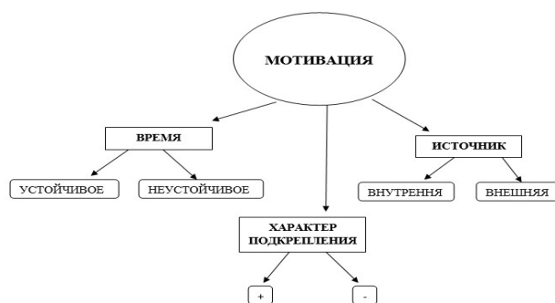
Рис. 1. Классификация по типам мотивации Fig. 1. Classification by Motivation Type

интринсивную (внутреннюю) мотивацию, положительную и отрицательную мотивации, материальную мотивацию – мотивацию, включающая в себя различные виды материального поощрения в виде премий, ценных подарков и т.д., нематериальную мотивацию – мотивацию, основанную на признании коллективом, нематериальные поощрения в виде почетных грамот и званий, мотив самоутверждения – стремление индивида укрепить себя в сообществе, социуме, мотив власти – стремление индивида влиять на окружающих его людей, процессуально-содержательный мотив – стремление индивида выполнять определенную деятельность, которая ему нравится [2] (Рисунок 1).