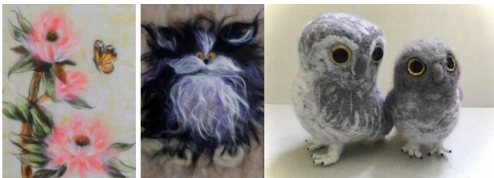
Рис. 8. Валяние

Обучать художественным навыкам и развивать систему по внедрению нового в систему обучения основам изобразительного языка очень важно. Совершенство не возникает сразу: оно требует для своей эволюции времени, и эволюция свершится в результате усилий всего общества, его целенаправленных действий [10]. Творческие работы представлены на рис. 8.