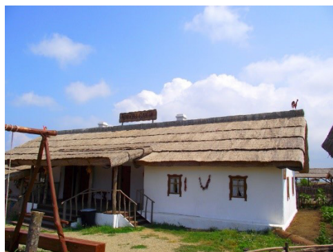
Рис. 2. Подворье казака

Этнографический комплекс станица Атамань – крупнейший и единственный в своем роде музей под открытым небом, который перенесет Вас на сотни лет в прошлое и позволит почувствовать дух казачества, негибимой воли и бескрайней свободы. Свежий и чистый воздух, щебетание птиц, шум моря, красивая казачка, встречающая гостей с хлебом-солью, уютные курени с домотанными ковриками на полу и старинными прялками в углу.