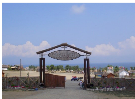
Рис. 1. Вход в станицу Атамань

Влияние художественно-творческой деятельности на процессе становления личности повышается в связи с воспитанием на культуре, традициях, обычаях своего народа. В нашем Краснодарском крае все это изучается в школе и предмет называется «Кубановедение». Чтобы изучать историю своего края была построена этнографическая станция «Атамань». Расположена станция на западной окраине станицы Тамань на берегу Таманского залива. Экспонаты музея собраны по станицам края и показывают быт и уклад жизни казацких семей XVIII-XX вв. Этнографический комплекс станица Атамань – это наша Кубань в миниатюре, здесь как в зеркале отразились древние казацкие традиции, обычаи, культура (рис. 1, 2).