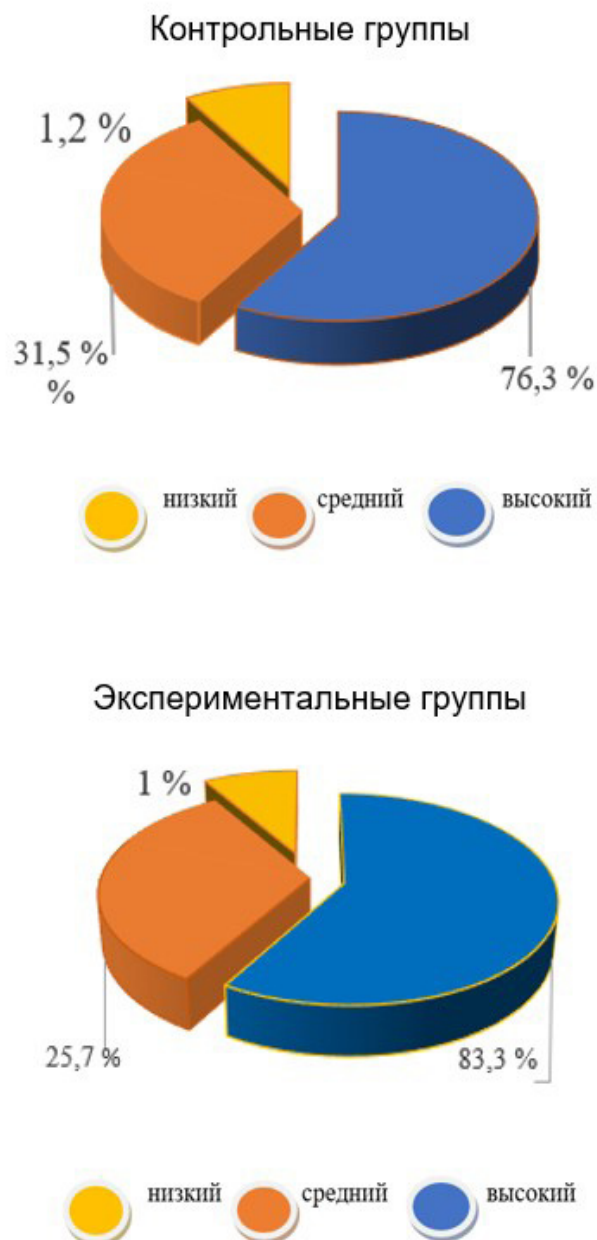
Рис. 7. Результаты исходной диагностики

Развивать художественные способности, то есть воспринимать произведения искусства, поможет на занятиях преподаватель. При обучении основам изобразительной грамоты, развивается, внимание, мышление, воображение – это неустанное изучение особенностей и закономерностей