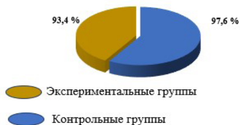
Рис. 6. Результаты изучения истории, культуры, традиций

Среди студентов было проведено исследование по участию и мероприятиях по изучению истории, культуры, традиций. Результаты показали, что 94,4 % студентов экспериментальных групп причастны к этим процессам, также как и 97,6% студентов контрольных групп (рис. 7). Это говорит