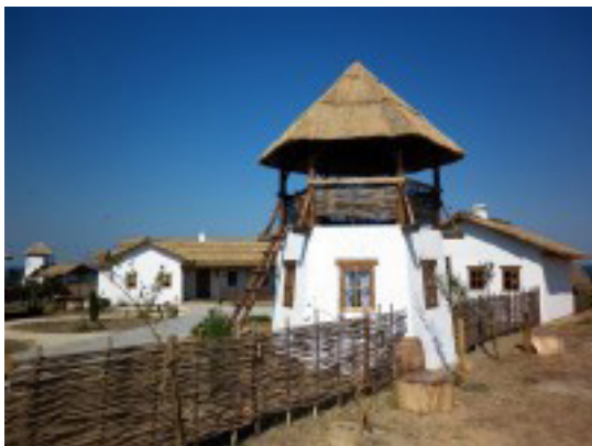
Рис. 3. Сторожевая башня