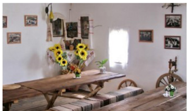
Рис. 5. Внутреннее убранство хаты казаков

Этот пласт во многом является инновационным. Вполне очевидны магическая, эстетическая и развлекательная функции культуры [5].