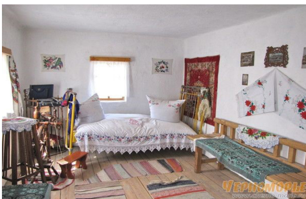
Рис. 4. Внутреннее убранство хаты